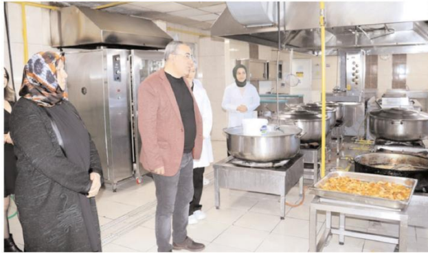
Yurtların yemekhaneleri kontrol edildi.

Öğrenciler ile sohbet edip taleplerini dinleyen Ünlüler, sonrasında yurt müdürleri ile denetimler ve kalite standartlarına ilişkin değerlendirme toplantısı yaptı.